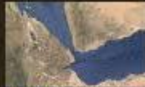
Bab el-Mandeb Strait