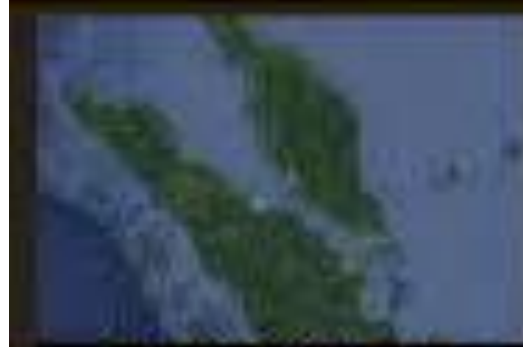
Strait of Malacca