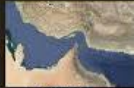
Strait of Hormuz