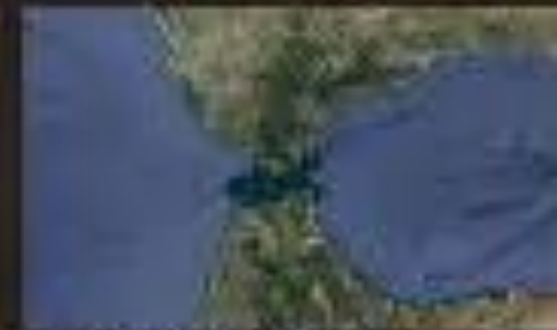
Strait of Gibraltar