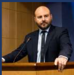
Γεώργιος Στασινός Πρόεδρος Τεχνικού Επιμελητηρίου Ελλάδας (tbc)