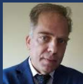
Γιώργος Φιντικάκης Δημοσιογράφος Euro2day