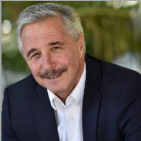
Δρ. Γιάννης Μανιάτης Καθηγητής Πανεπιστήμιο Πειραιώς Ελλάδα