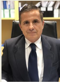
καθηγ. Κωνσταντίνος Αραβώσης Γενικός Γραμματέας Φυσικού Περιβάλλοντος και Υδάτων Υπουργείο Περιβάλλοντος και Ενέργειας Ελλάδα