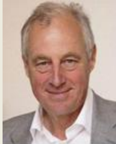
Mr. Tim Yeo Chairman The New Nuclear Watch Institute (NNWI) Ex Secretary of Energy and MP London, UK