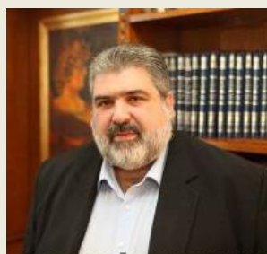
κ. Παναγιώτης Πλακεντάς Δήμαρχος Δήμος Εορδαίας