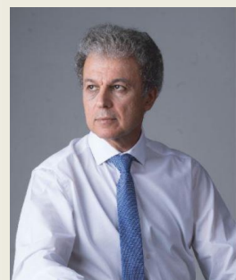
κ. Γιώργος Αμανατίδης Βουλευτής Ν. Κοζάνης Νέα Δημοκρατία