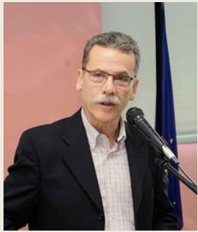
κ. Λάζαρος Μαλούτας Δήμαρχος Δήμος Κοζάνης