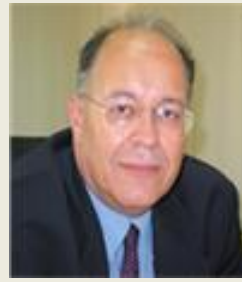
καθηγ. Παντελής Κάπρος Διευθυντής E3M Lab, Εθνικό Μετσόβιο Πολυτεχνείο, Πρόεδρος Επιστημονικού Συμβουλίου ΙΕΝΕ Ελλάδα