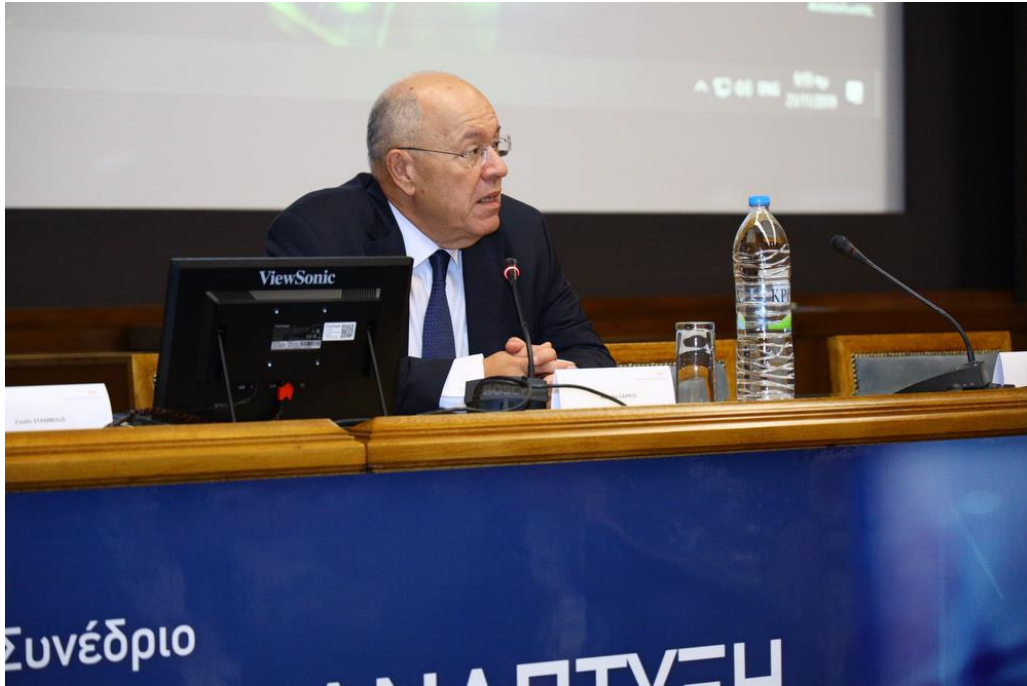
Εισαγωγικά Σχόλια από τον Καθηγ. Παντελή Κάπρο , Πρόεδρο Επιστημονικού, ΙΕΝΕ, Δ/ντής Ε3Μ Lab. ΕΜΠ,