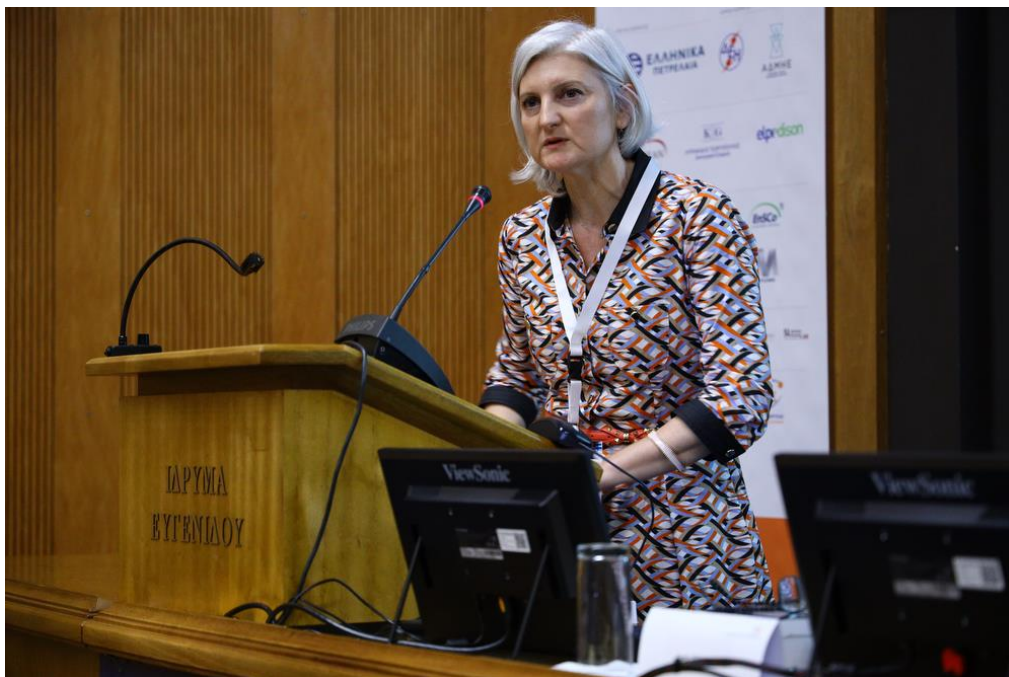
Ομιλία από την κα. Ειρήνη Νικολάου , Policy Officer, DG Climate Action, European Commission, Unit B2 – ETS Implementation & IT, Brussels