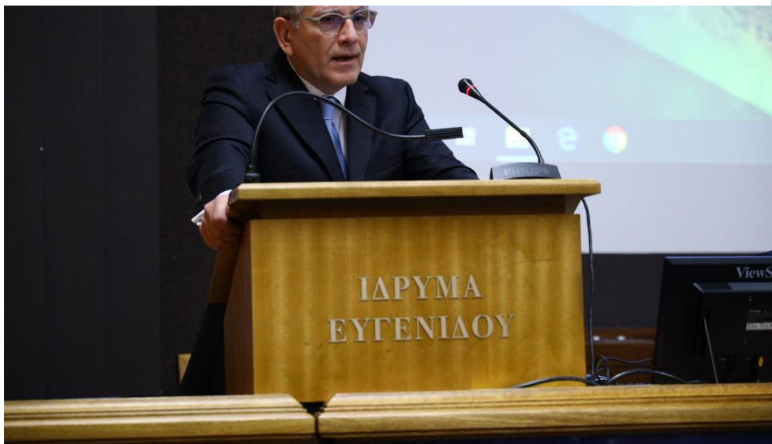
Ομιλία Υφυπουργού Περιβάλλοντος και Ενέργειας, κ. Γεράσιμου Θωμά